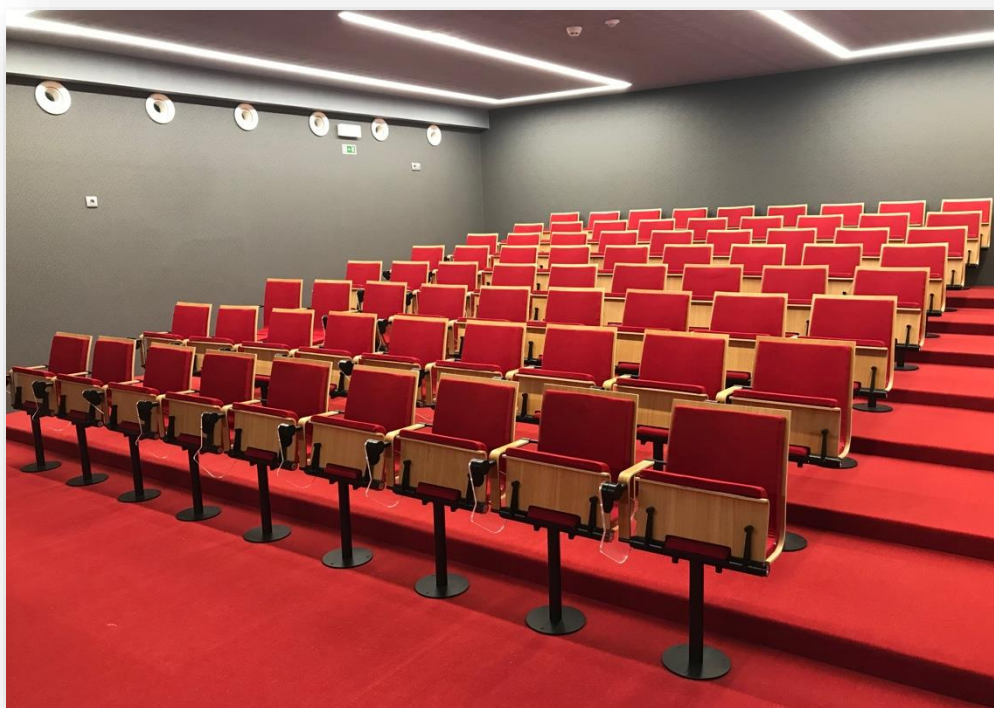
Auditório - Academia de Música de Arouca

facebook: https://www.facebook.com/profile.php?id=100010482513134